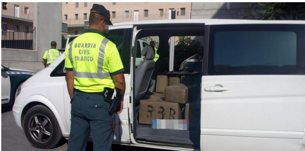
Imagen N.º 1: Furgoneta con cristales tintados.