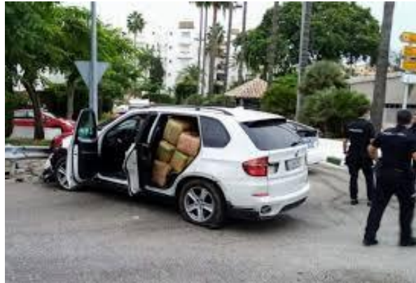
Imagen N.º 3 y 4: Todoterrenos de alta cilindrada para transportar desde las playas la mercancías.