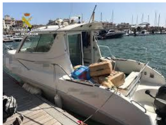
Imagen N°2 y N°3: También utilizan otro tipo de embarcación como la de la imagen anterior, que son menos potentes, pero pueden pasar más desapercibidas para las Fuerzas y Cuerpos de Seguridad, por ser embarcaciones de recreo o embarcaciones de pesca.