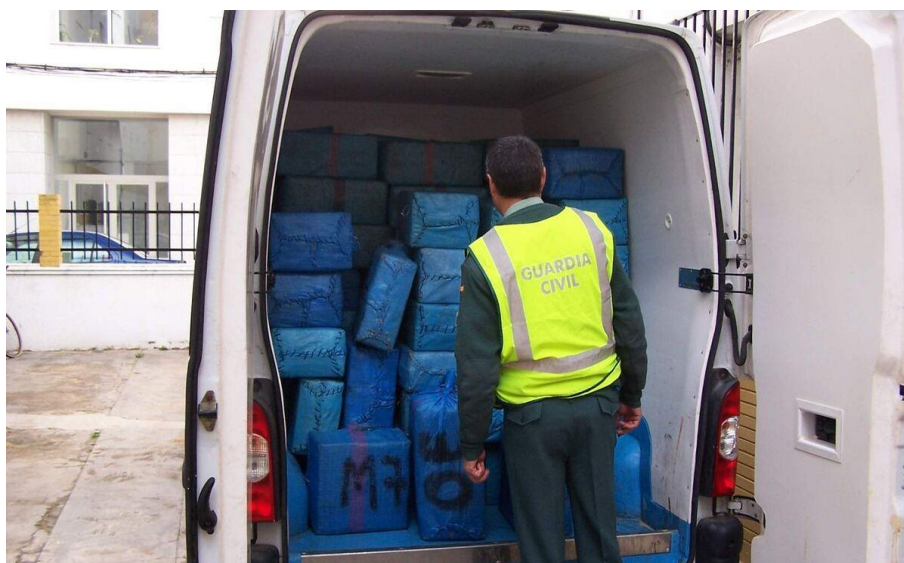
Imagen N.º 2: Furgoneta paquetera (sin acristalar).