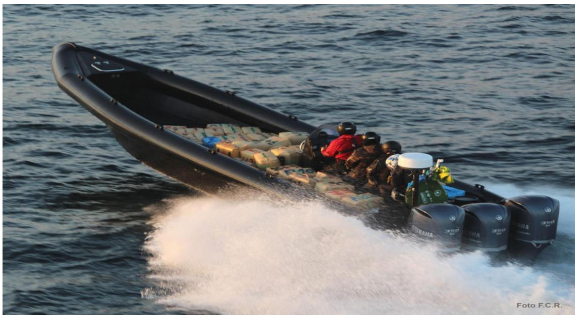
Imagen N°1 : Zodiacs semirrígida, con TRES motores de gran cilindrada, 4 narcotraficantes en su huida de los cuerpos y fuerzas de seguridad. Además, podemos observar la gran cantidad de kilos de hachís que pueden transportar en este tipo de embarcaciones.

Pueden usar cualquier tipo de embarcación para el transporte del hachís, desde motos de agua a barcos de grandes dimensiones. Las embarcaciones usadas habitualmente son zodiacs semirrígidas con grandes motores o embarcaciones de recreo de cinco a siete metros de eslora.