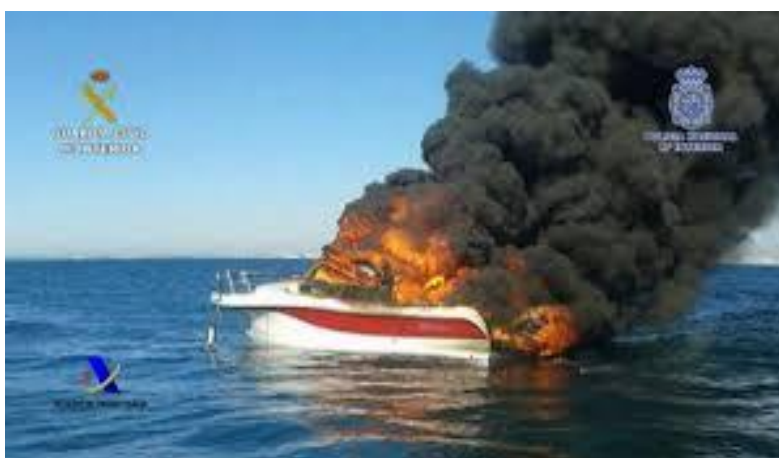
Imagen N.º 4: Embarcación con hachís en doble fondo, a la que los traficantes prenden fuego cuando están siendo seguidos por el Servicio de Vigilancia Aduanera y Guardia Civil (no se podían desprender de la mercancía porque esta se encontraba en un doble fondo practicado en la embarcación).

Imagen N°2 y N°3: También utilizan otro tipo de embarcación como la de la imagen anterior, que son menos potentes, pero pueden pasar más desapercibidas para las Fuerzas y Cuerpos de Seguridad, por ser embarcaciones de recreo o embarcaciones de pesca.