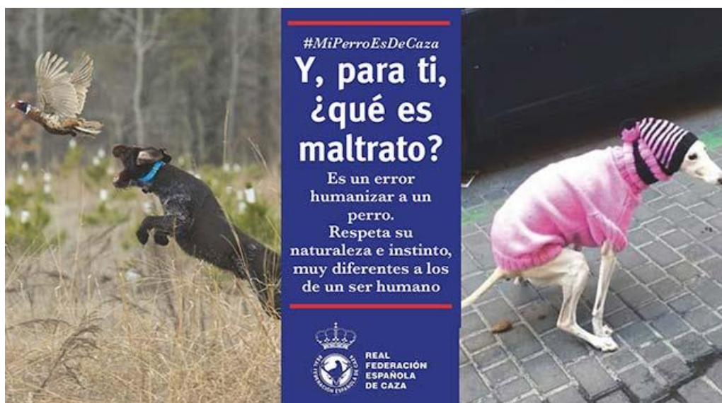
Imagen de la campaña de la RFEC sobre el maltrato de perros por la humanización de los mismos.

todos los aspectos, intentando producir cambios sustanciales en la sensibilización de la sociedad actual.